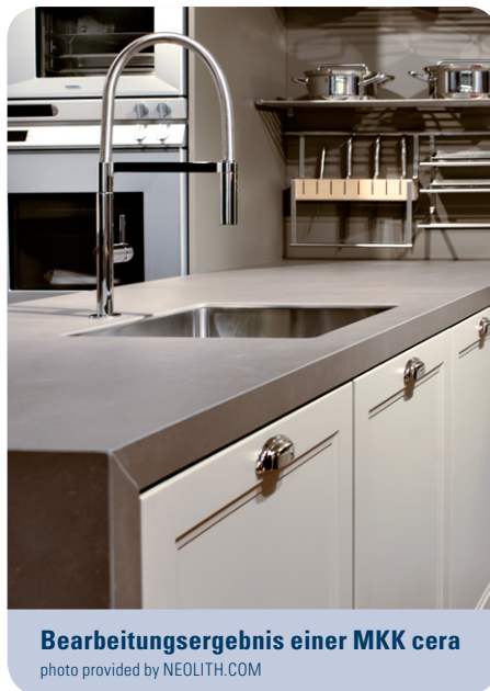
Bearbeitungsergebnis einer MKK cera