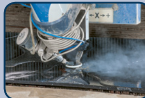
5-Achs-Technik für 3D Bearbeitung